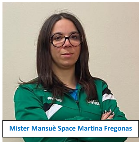
Mister Mansuè Space Martina Fregonas